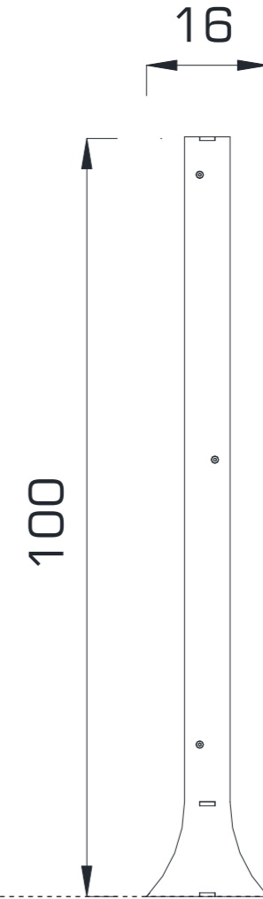
YAN GÖRÜNÜŞ / SIDE VIEW

Gösterilen ölçüler cm cinsindedir / Dimensions shown are in cm